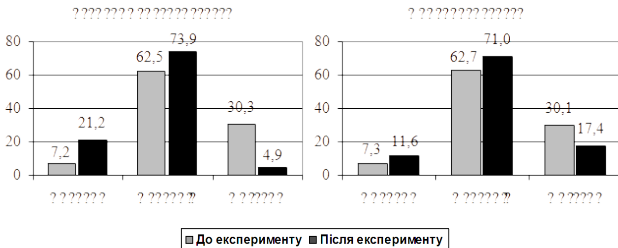
Рис. 2. Динаміка рівнів сформованості толерантності у молодших підлітків експериментальних та контрольних класів

Водночас значно знизився рівень прояву складових інтолерантності в учнів експериментальних класів, зокрема „агресивності” (з 1,26 до 0,45 балів) та „конфліктності” (з 1,57 до 0,53 бали). Використання t-критерію Ст’юдента доводить, що на рівні статистичної достовірності зміни відбулись за показниками відповідальності ( t=4,675 ; при p \leq 0,05 ), комунікативності ( t=4,173 ; при p \leq 0,05 ); самостійності ( t=3,843 ; при p \leq 0,05 ).