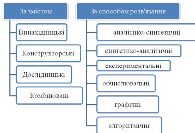
Рис. 1. Класифікація фізичних задач за фізичним змістом і способом розв'язання

Для розв'язку задач на практичних заняттях із фізики студентами Льотної академії НАУ потрібно розвивати мислення, що є важливою компонентою розумового розвитку особистості в умовах STEM-освіти.