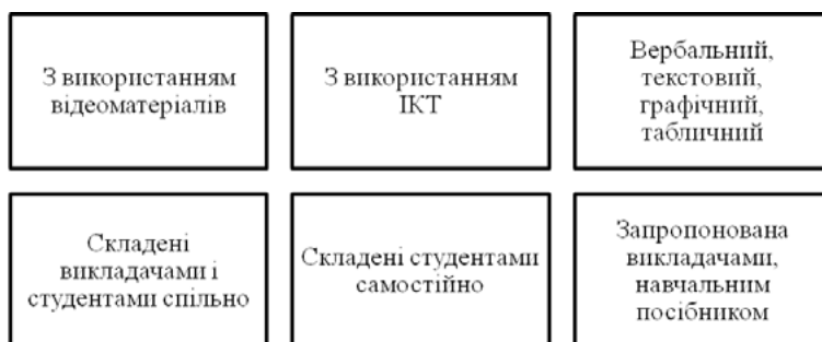
Рис. 2. Класифікація фізичних задач за способом постановки

зв'язків, і внаслідок цього виступає в нових якостях, які фіксуються в нових поняттях; з об'єкта таким чином ніби вичерпується все новий зміст, він ніби повертається кожного разу іншим боком, у ньому виявляються все нові якості. У міру того, як студент під час систематичного навчання починає оволодівати сукупністю знань, хоча б елементарних, але побудованих у вигляді системи, мислення його неминуче починає перебудовуватися" (Рубинштейн, 1999).