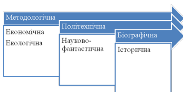
Рис. 3. Класифікація фізичних задач за розробленою тематикою

Розвиток мислення студентів може здійснюватися лише під час активної розумової діяльності з вирішення проблем саме за вивчення природничо-наукових дисциплін, оскільки існує принципова можливість організувати продуктивну діяльність такого роду, тому що міжпредметну інтеграцію, закладену як прийом розумової діяльності, можна розуміти також як систему синтезу та узагальнення під час розв'язування пізнавальних задач. Розв'язування задач із фізики є характерною і водночас специфічною особливістю інтелектуальної діяльності суб'єктів навчання (Розв'язування навчальних задач з фізики, 2004).