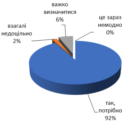
Рис. 3. Чи вважаєте Ви за потрібне готувати майбутніх педагогів до реалізації міждисциплінарного підходу у професійній діяльності