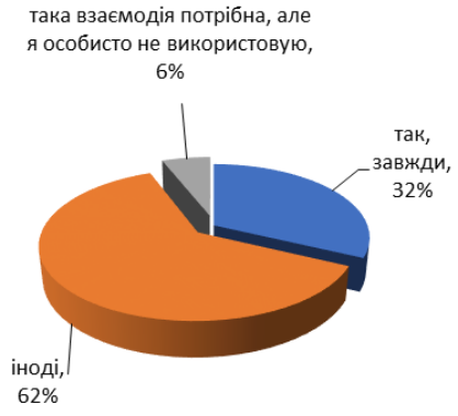
Рис. 2. Чи взаємодієте Ви з колегами у реалізації міждисциплінарного підходу? Чи потрібна взагалі Вам така взаємодія?