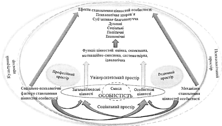
Рис. 1. Модель становлення цінностей особистості віку ранньої дорослості

поведінки. Водночас у межах соціокультурного простору (університетського, професійного, родинного) більшою мірою актуалізуються духовні потенціали, які підвищують внутрішні ресурси особистісного зростання людини періоду дорослості. Отже, ціннісна система особистості ранньої дорослості являє собою більш-менш стійку систему соціокультурних цінностей і морально-духовних норм, які визначають як її стереотипи, так і творчі прояви в поведінці, почуттях та мисленні.