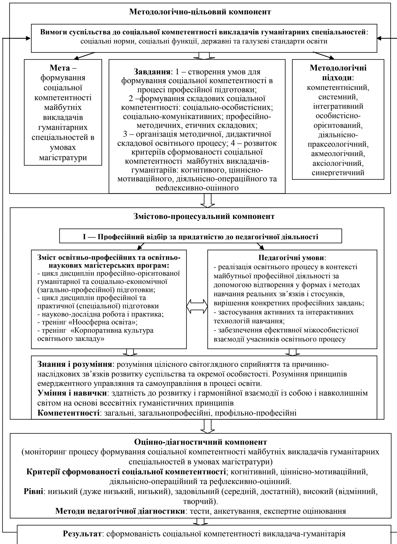
Рис. 3. Модель формування соціальної компетентності майбутніх викладачів гуманітарних спеціальностей в умовах магістратури