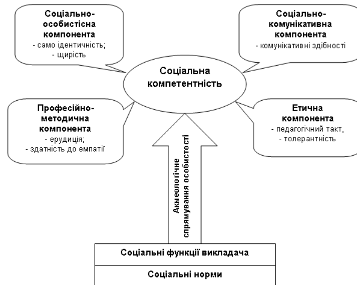
Рис. 1. Структура соціальної компетентності викладача

Зазначені складові соціальної компетентності мають ґрунтуватися на акмеологічному спрямуванні особистості викладача, що орієнтує його на професійний і особистісний розвиток, творчу самореалізацію у професійній сфері та життєдіяльності в цілому. Крім того, у процесі дослідження визначено, що основою для формування і детермінації соціальної компетентності мають бути соціальні норми і соціальні функції викладача (рис. 1).