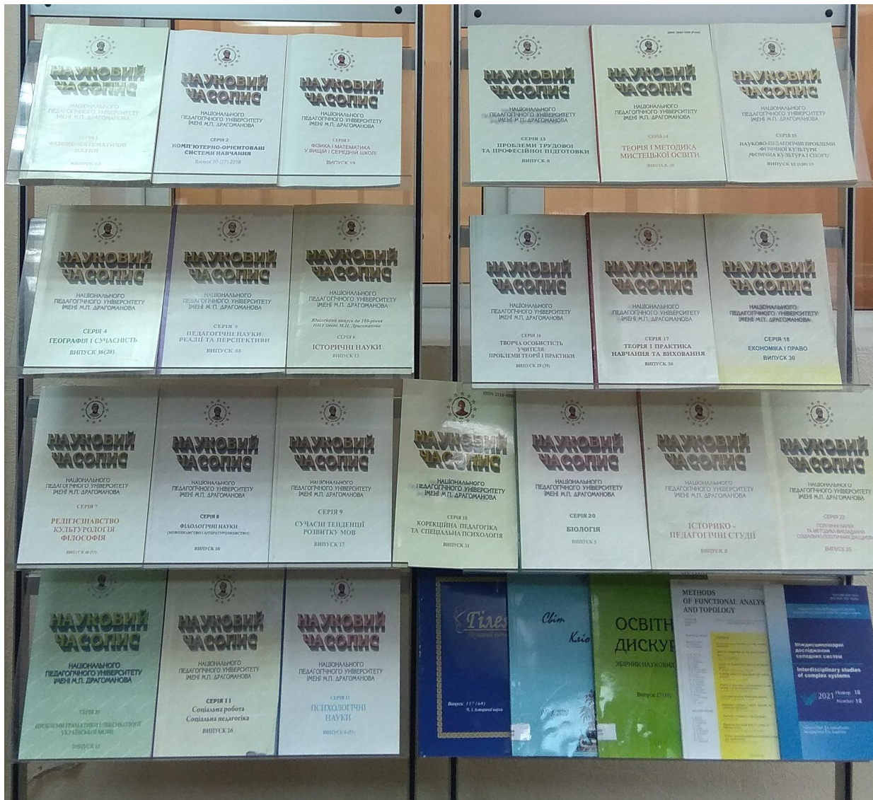
Наукові збірники НПУ ім. М. П. Драгоманова