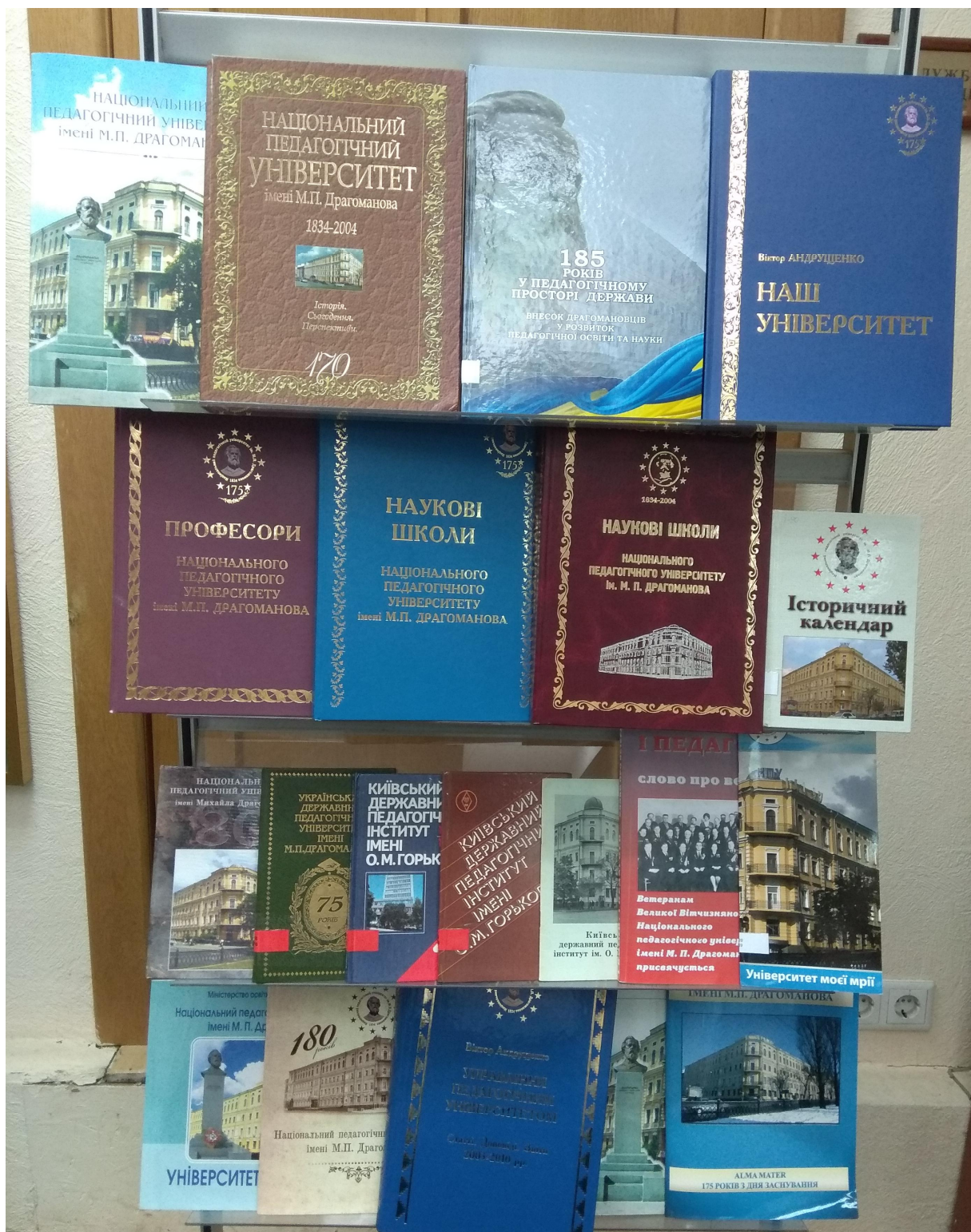
Книги з історії НПУ імені М. П. Драгоманова