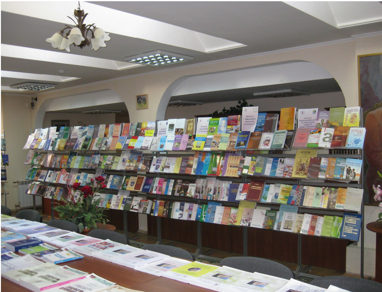
2014 р. Книжкова виставка до 180-річчя НПУ імені М. Драгоманова