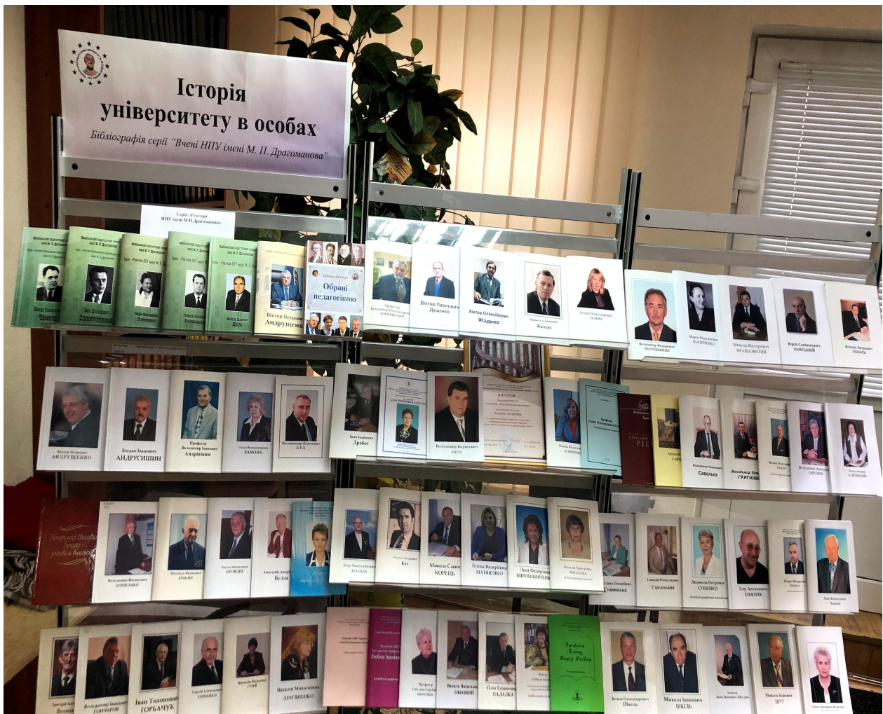
Біобібліографічна серія "Вчені НПУ ім. М. П. Драгоманова"