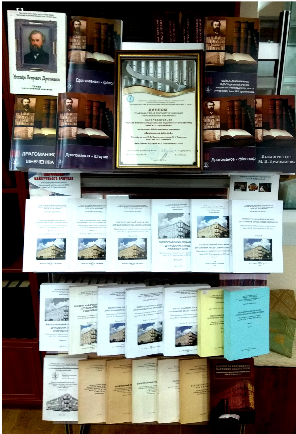
Бібліографічна Драгоманіана – [“Драгоманов – філософ” : нагороджений Інститутом біографістики Дипломом учасника ТОП-10 у номінації “Персональний покажчик” Всеукраїнського бібліотечного “БІОГРАФІЧНОГО РЕЙТИНГУ-2018” Національної бібліотеки України ім. В. І. Вернадського] ; “Бібліографічні покажчики друкованих праць співробітників НПУ імені М. П. Драгоманова” (1944-2020)