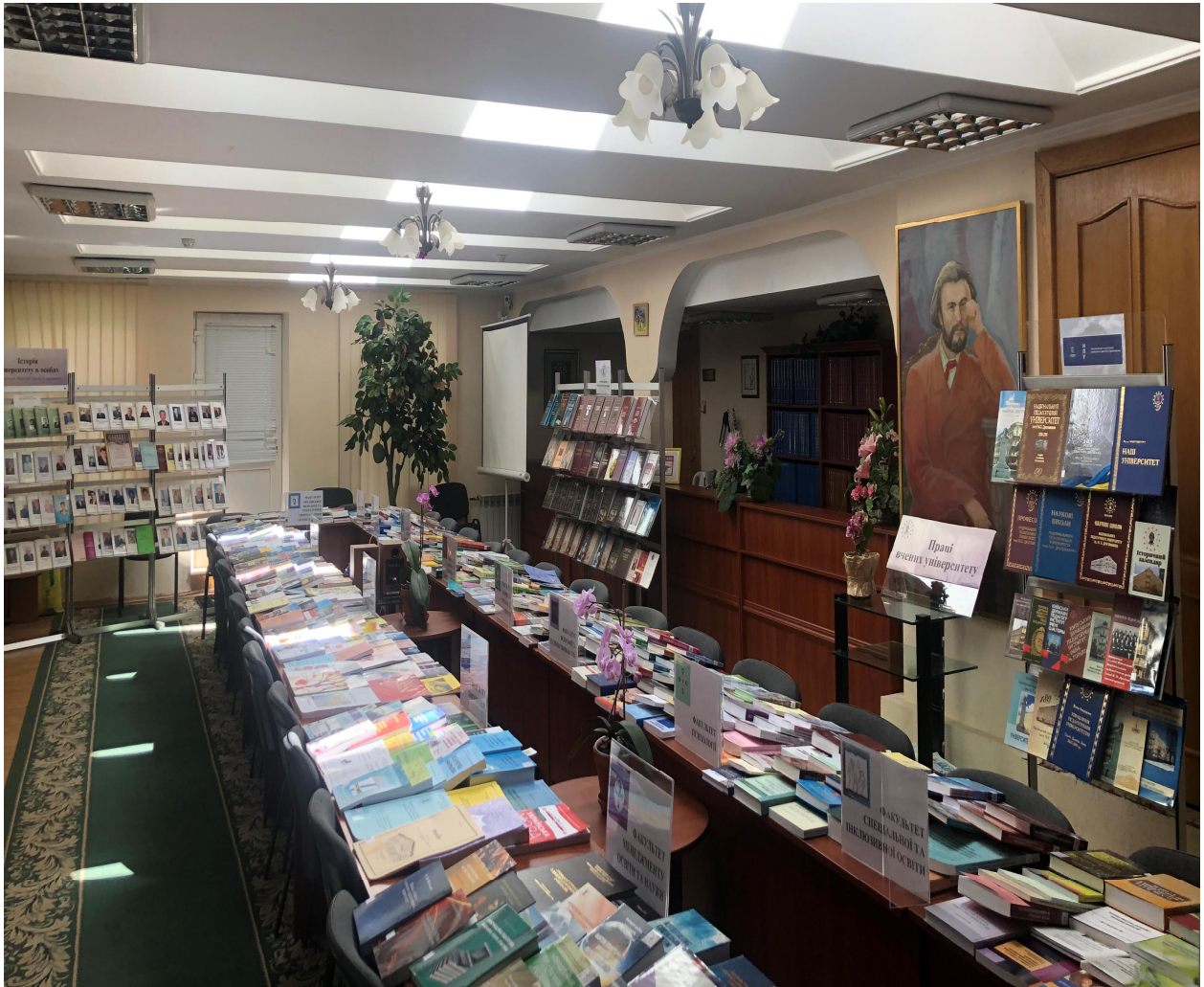
2021 р., червень. Виставка книг викладачів НПУ імені М. П. Драгоманова (до 185-річчя НПУ імені М. П. Драгоманова)