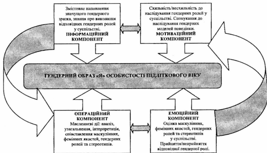
Рис. 1. Структура гендерної ідентичності особистості підліткового віку

Аналіз наукових позицій вчених дозволив виділити структурні компоненти гендерної ідентичності: 1) інформаційний компонент (Т.Бендас, І.Малкіна-Пих, Л.Клочек); 2) мотиваційний компонент (А.Варга, В.Синявський, Б.Федоришина); 3) операційний компонент (А.Еткінд, І.Клецина, В.Кузьмін, Б.Ломов, В.Румянцева); 4) емоційний компонент (А.Мехрабієн, Н.Епштейн, Т.Репіна, І.Романов). Схематично психологічна структура гендерної ідентичності особистості підліткового віку зображена на рис.1.