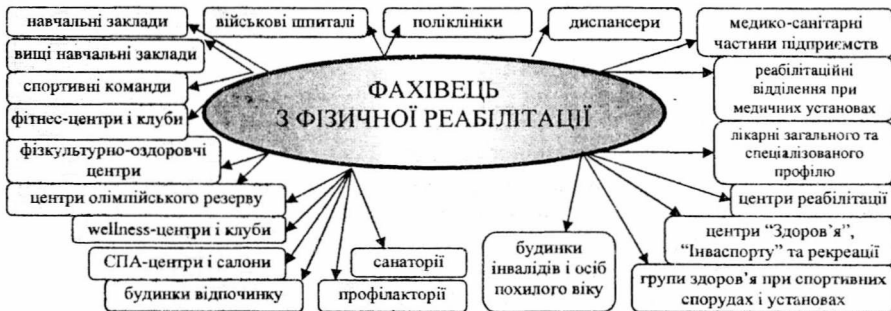
Рис. 1. Середовище професійної діяльності фахівців з фізичної реабілітації (за Л.П. Сущенко, 2003; доповнено О.В. Погонцевою, 2009).

технологіями відновлення здоров'я людини, але й на оволодіння сучасними оздоровчими та профілактичними технологіями зміцнення здоров'я населення України. Саме тому з таких позицій розглядається сучасне середовище професійної діяльності фахівців з фізичної реабілітації (рис. 1).