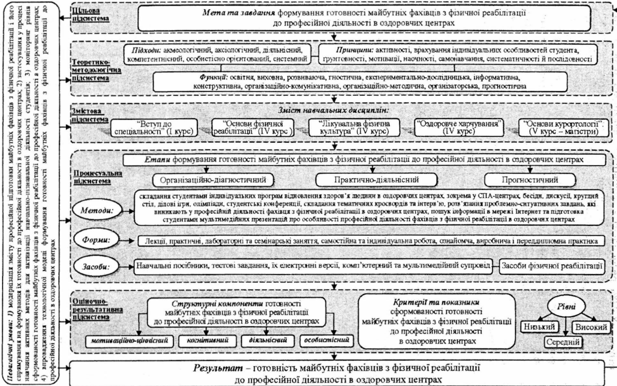
Рис. 2. Технологічна модель формування готовності майбутніх фахівців з фізичної реабілітації до професійної діяльності в оздоровчих центрах