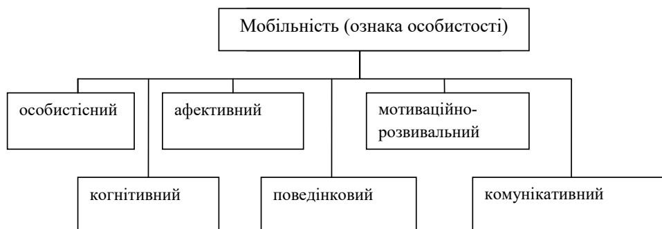
Рис. 2. Мобільність як ознака особистості

Представимо мобільність у вигляді ознаки особистості з компонентами: особистісний (вроджені та набуті риси характеру), когнітивний (інформаційний), афективний (емоційний), поведінковий, мотиваційно-розвивальний і комунікативний (рис. 2).