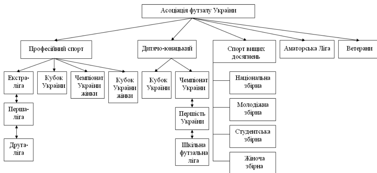
Рис. 2. Система змагань з футболу, що проводяться під егідою АФУ

Важливим моментом в розвитку виду спорту є система змагань. Асоціація футболу України проводить змагання з усіх основних напрямків розвитку спорт: професійного – чемпіонат, першість, Кубок України та Суперкубок України серед команд професійних клубів; чемпіонат, першість і Кубок України серед жіночих команд; спорту вищих досягнень – збірні команди України (Національна, молодіжна, студентська, жіноча) дотримуючись міжнародного календаря матчів, складеного ФІФА/УЄФА; та масового спорту – чемпіонат та Кубок України серед аматорських команд; чемпіонати та першості серед аматорів фізкультурно-спортивних товариств та відомств; чемпіонат і першість України серед дитячо-юнацьких команд у різних вікових категоріях; чемпіонат та Кубок України серед студентських команд (рис.2).