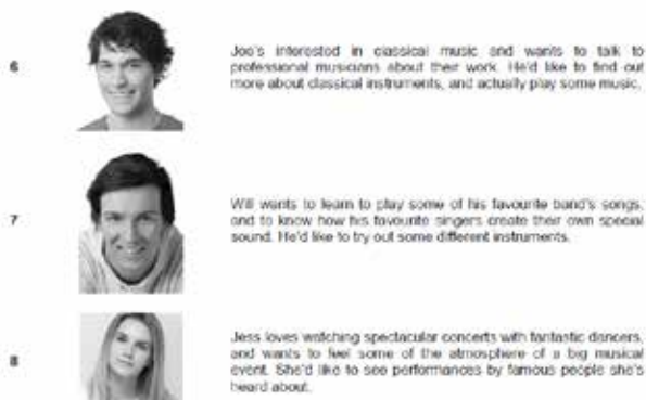
Рис. 2. Фрагмент тесту Preliminary Simple Paper 6 PET (Preliminary English Test) (2015) з розділу Reading and Writing

The people below all enjoy music. On the opposite page there are descriptions of eight places where people can have different musical experiences. Decide which place would be the most suitable for the following people. For questions 6 – 10, mark the correct letter (A – H) on your answer sheet