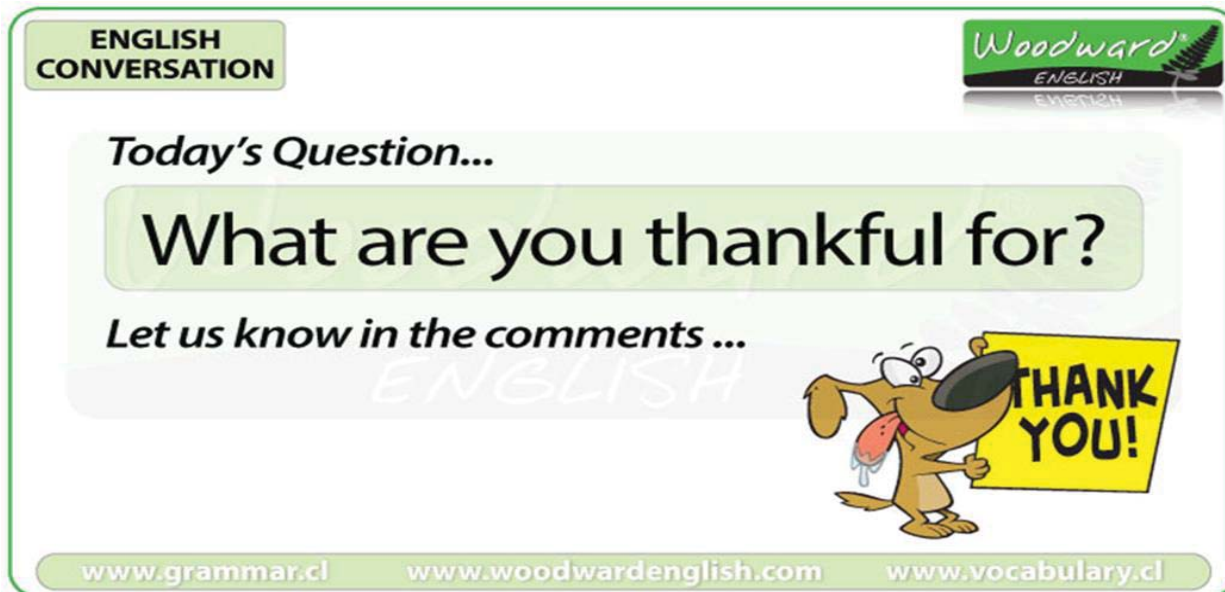
Рис.3. English Conversation

Відповідь: I am thankful for (something)