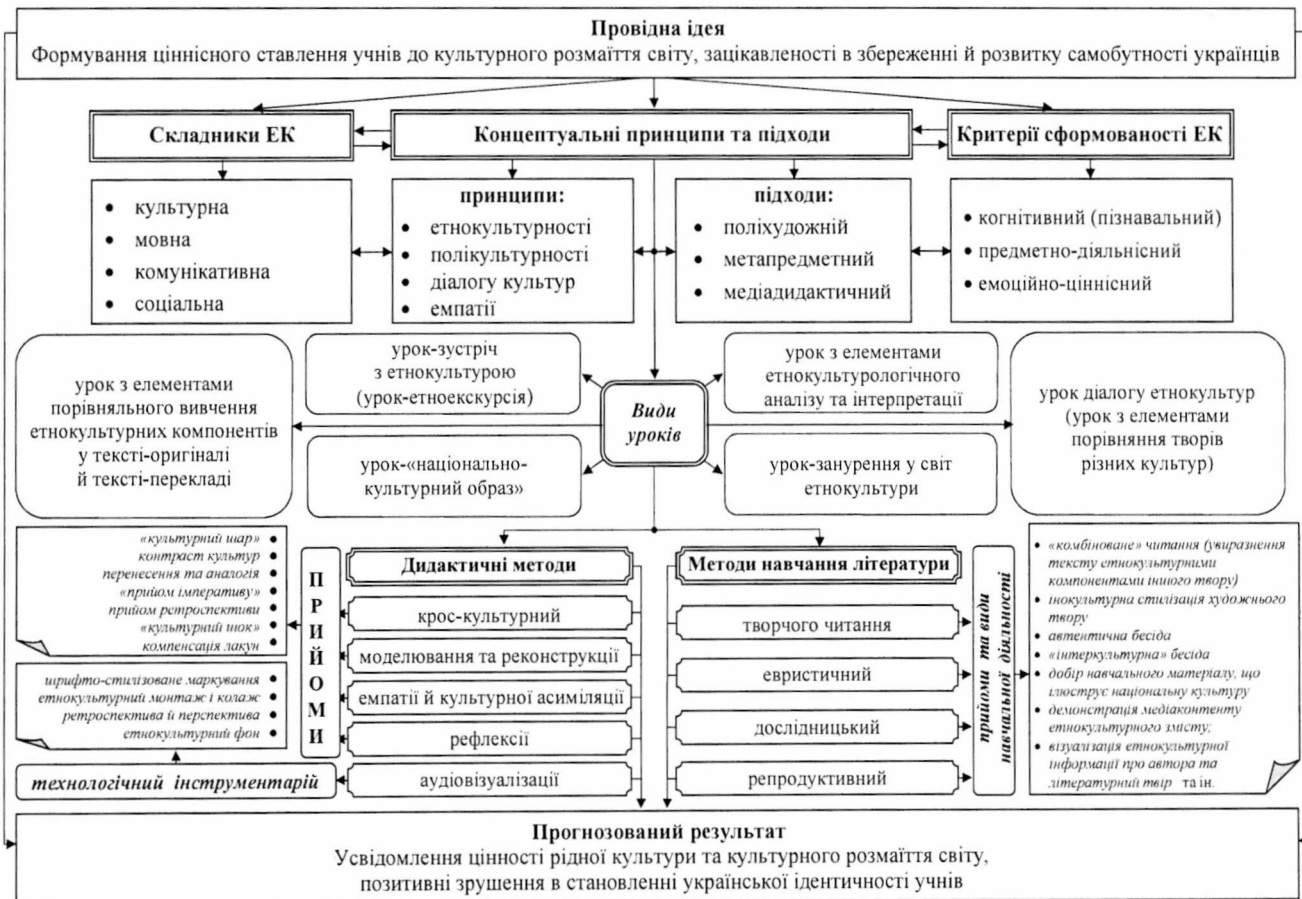
Рис. 1. Модель методичної системи формування етнокультурної компетентності учнів 5–7 класів у процесі вивчення зарубіжної літератури