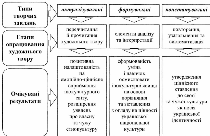
Рис. 2. Типологія творчих завдань у системі видів навчальної діяльності щодо формування етнокультурної компетентності учнів 5–7 класів у процесі вивчення зарубіжної літератури (за О. Дем'яненко)

Уточнено мету та зміст видів навчальної діяльності, спрямованих на розвиток інтелектуального потенціалу й креативного мислення підлітків, глибше осягнення ними національної специфіки на основі типології творчих завдань ученого-методиста О. Дем'яненко актуалізувальних, формувальних і констатувальних (рис. 2).