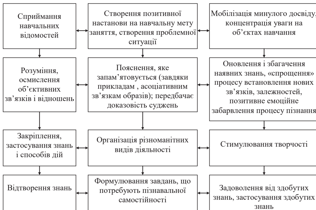
Рис.1. Основні етапи засвоєння знань на сучасному занятті

Традиційно етапами засвоєння студентами транспортного коледжу знань з фахових дисциплін є сприймання, усвідомлення, осмислення та розуміння, закріплення, застосування, узагальнення та систематизація знань, самоконтроль та самооцінювання (рис. 1).