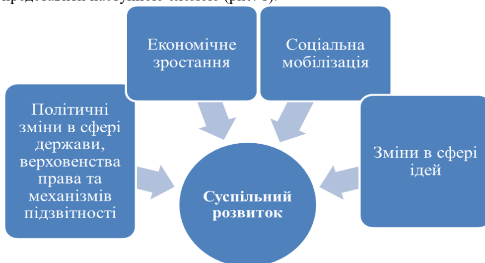
Рис. 1 Основні складові суспільного розвитку (за С. Хантінгтоном та Ф. Фукуямою)

Основні складові суспільного розвитку за висновками С. Хантінгтона та Ф. Фукуяма можна представити наступною схемою (рис. 1).