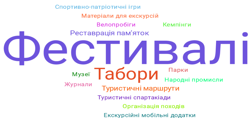
Рис. 2.5 Групи проектів присвячені туризму на платформах Спільнокошт та Na-Starte

(.. за популярністю відображений в інфографіці. (рис. 2.5)