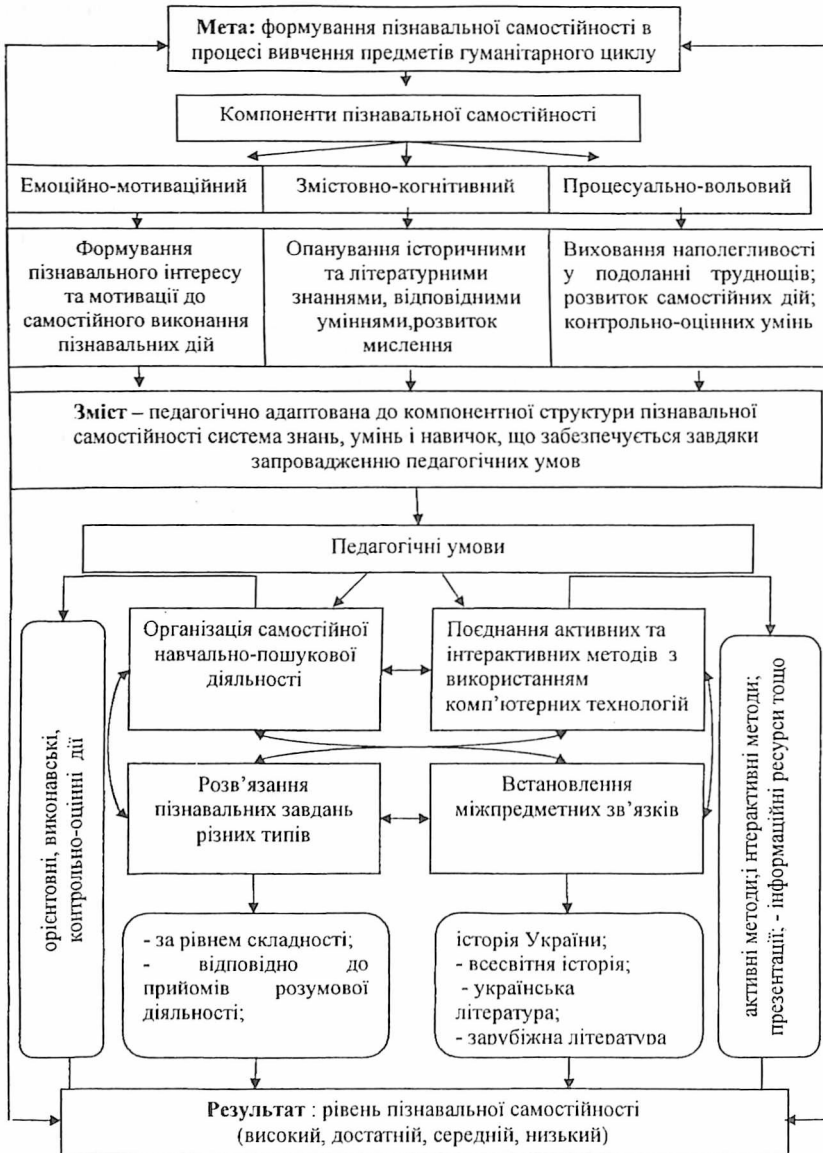
Рис. 1. Структурно-функціональна модель формування пізнавальної самостійності.