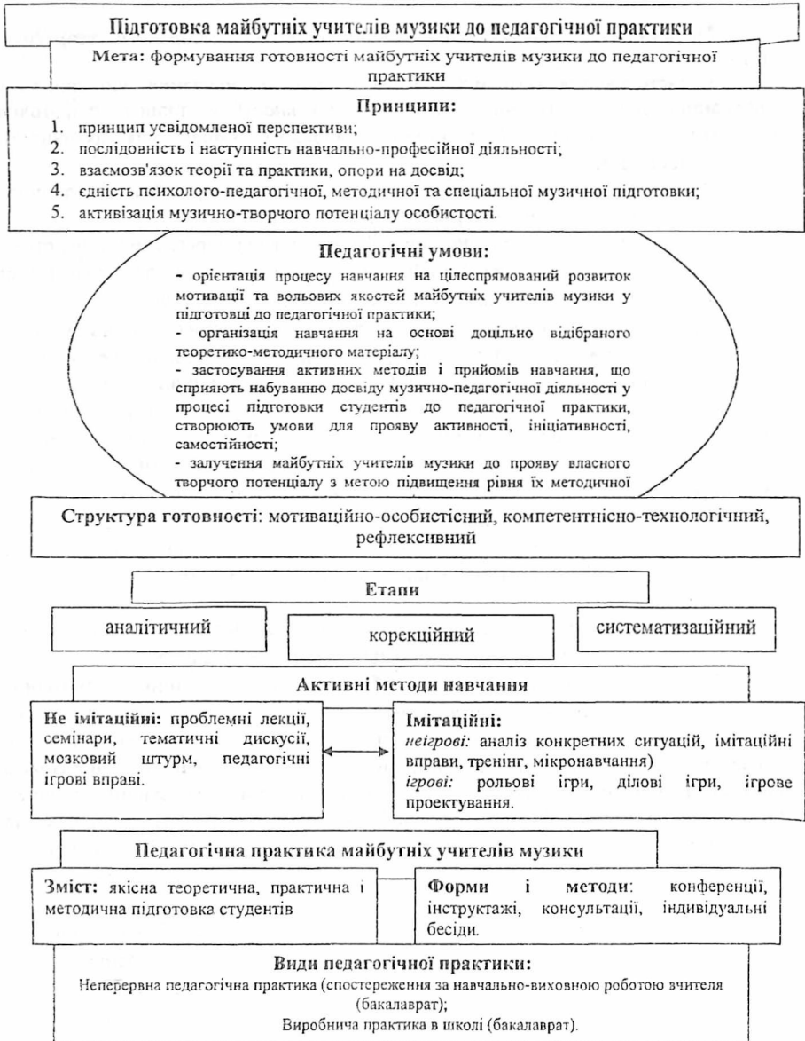
Рис. 1. Методична модель підготовки майбутніх учителів музики до педагогічної практики