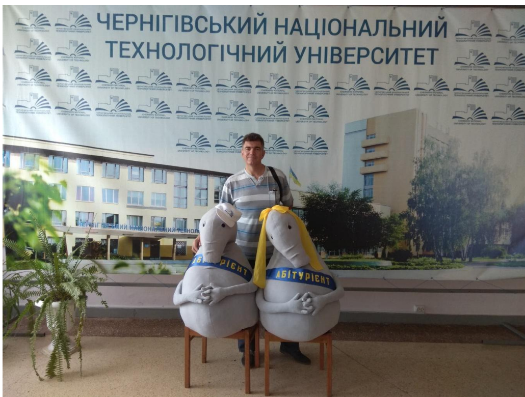
Вивчення досвіду формування контингенту студентів, Чернігів, 2015