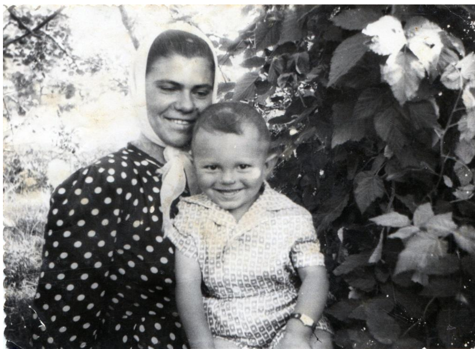
"Рідна мати моя, Ти ночей не доспала...", 1965 рік