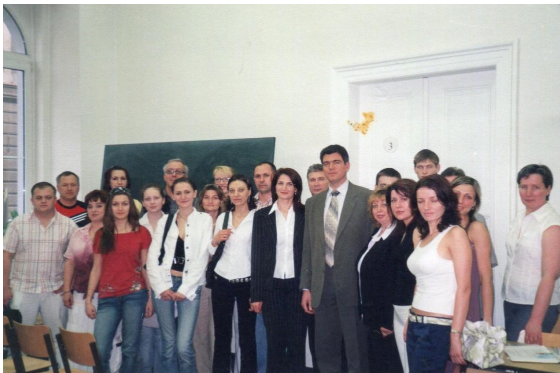
Зустріч зі студентами філії НПУ в м. Прага (Чехія), 2010 рік