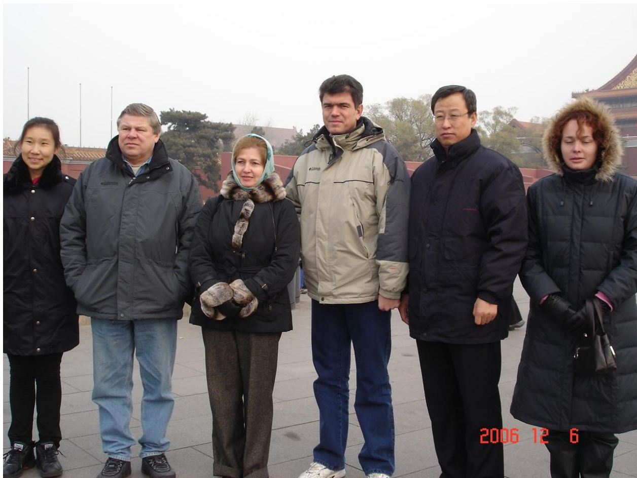
Делегації НПУ імені М. П. Драгоманова на площі Тяньаньмень, Пекін, 2006 рік