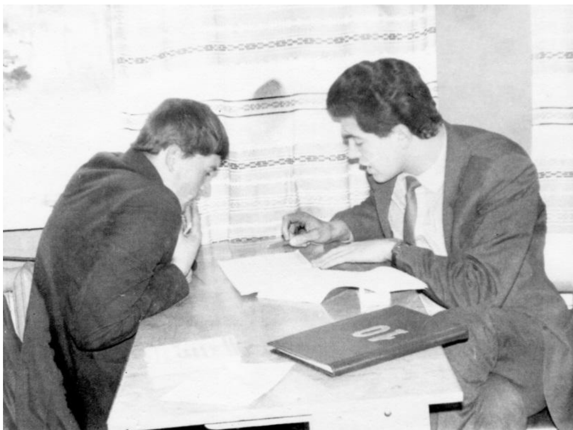
Розв'язування задач з учнями 10 класу Северинівської середньої школи, 1987 рік