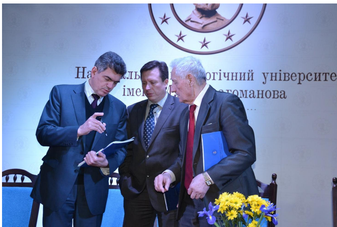
Підготовка до конференції трудового колективу, 2018 рік