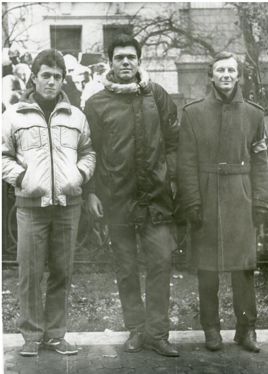
1983 р. Студенти фізмату під час чергування "Народних дружин"