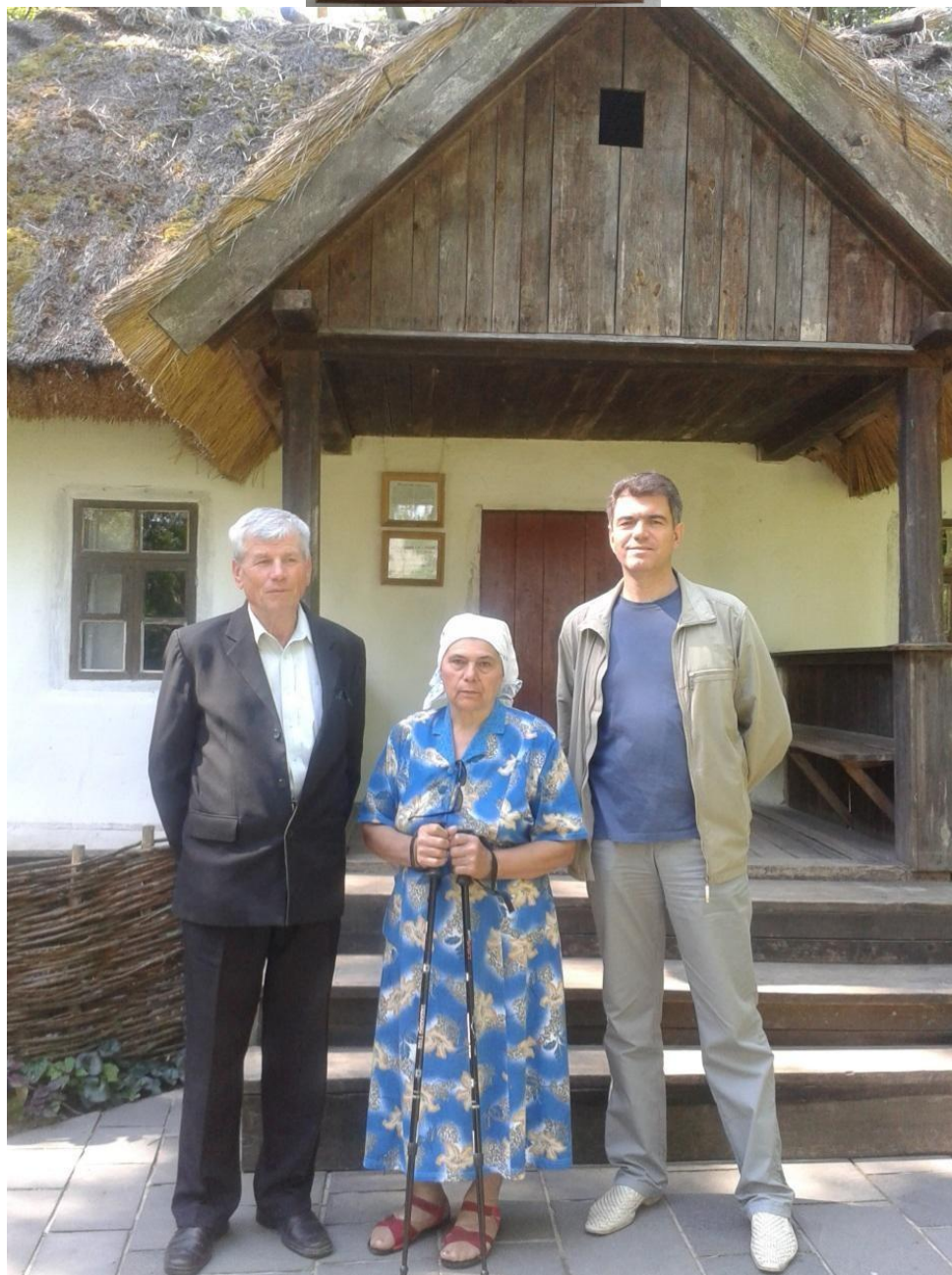
На Чернечій горі, біля Тарасової світлиці, Канів, 2014 рік