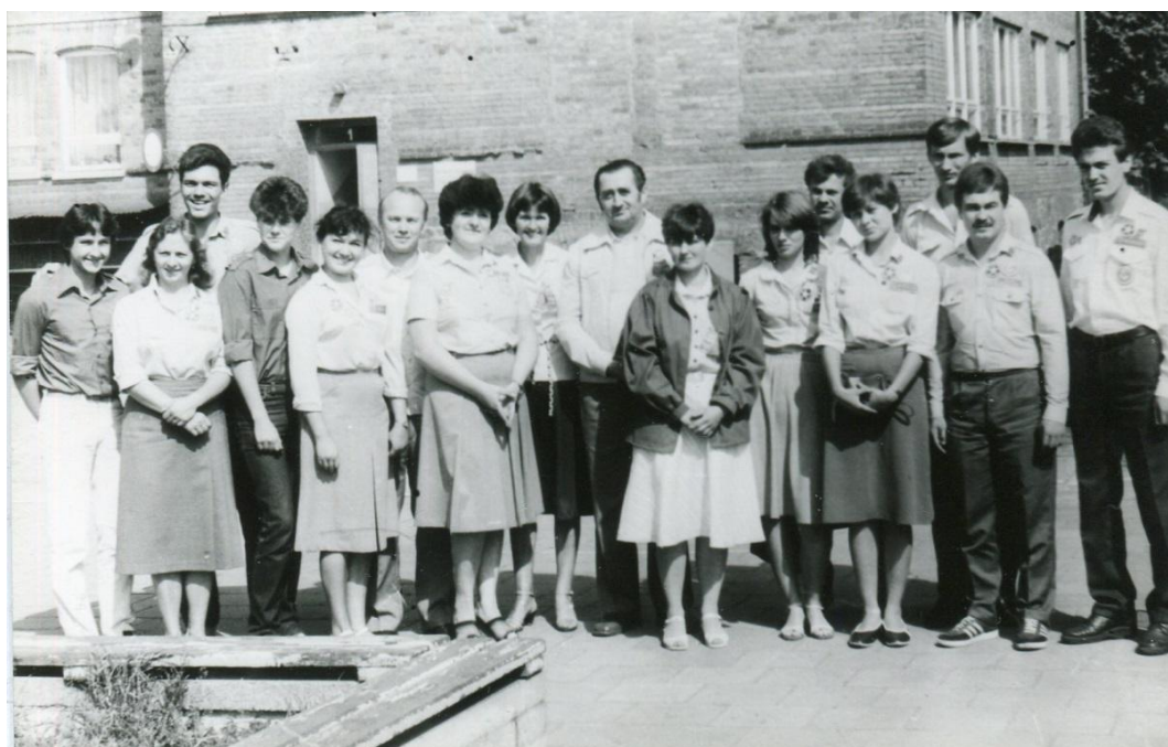
Зустріч членів будзагону з керівництвом та активістами місцевої школи. 1985 р., липень., м. Троєнбрицин (Німеччина)