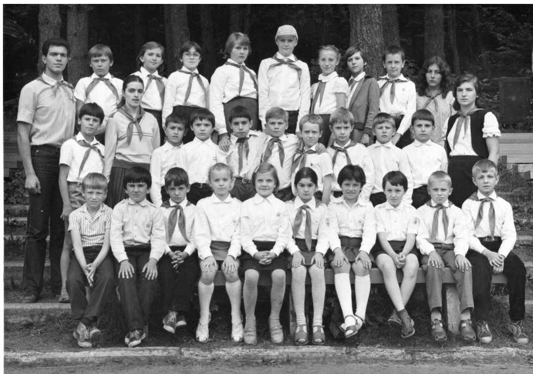
Інтернаціональна літня піонерська практика студентів ІІІ курсу фізико-математичного факультету в піонерському таборі "Орлятко" Бориспільського району, 1984 рік