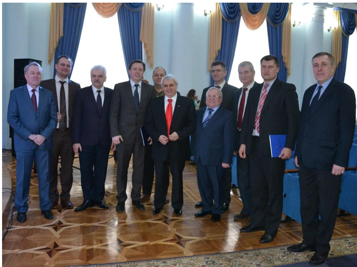
Керівництво університету , 2017 рік