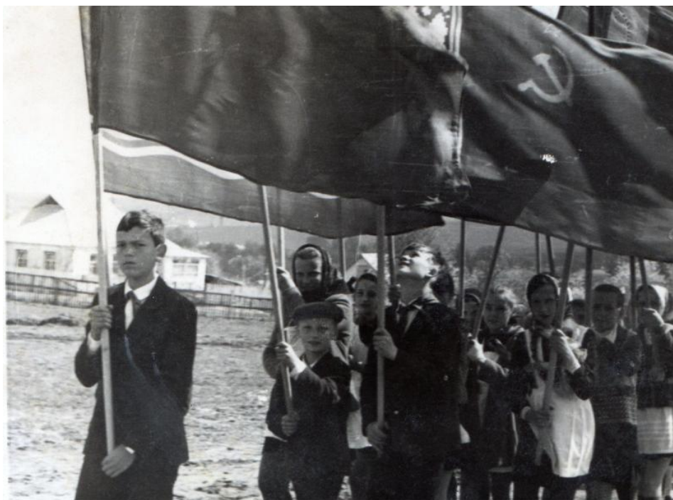
Учні Северинівської середньої школи під час травневої демонстрації, 1975 р.