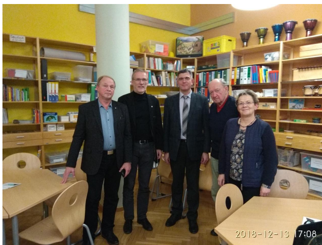
Зустріч з керівництвом Ерфуртської школи освіти університету м. Ерфурт (Німеччина), 2018 рік