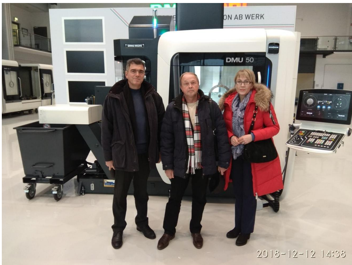
Відвідання партнера з дуального навчання - фірми "DMG MORI", світового лідера з виробництва програмованих станків, Німеччина, 2018 рік