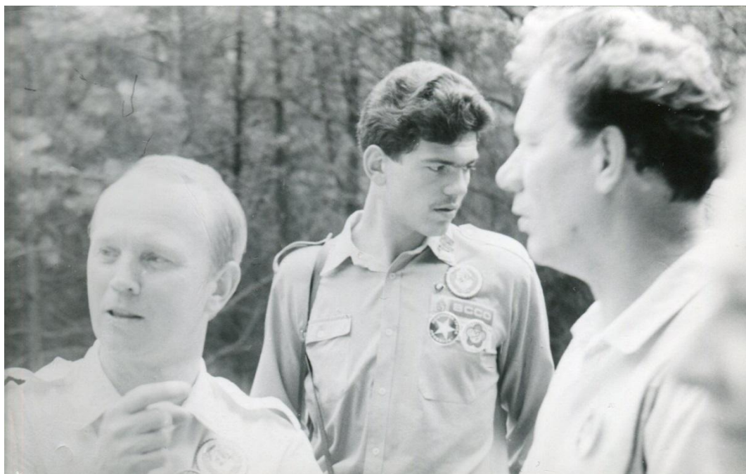
У будівельному загоні у Німеччині. 1985 рік