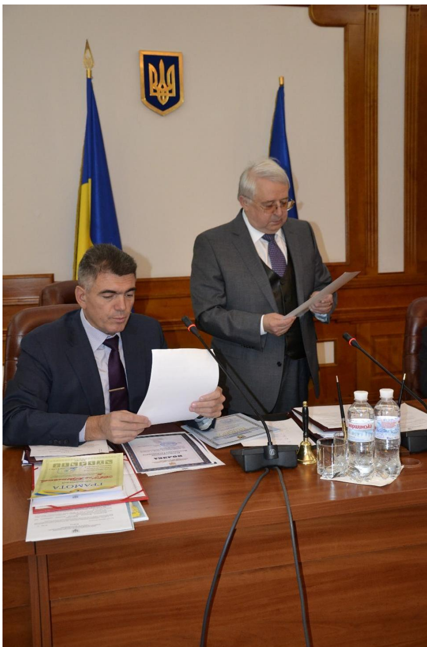
На засіданні Вченої ради НПУ імені М. П. Драгоманова, 2017 рік