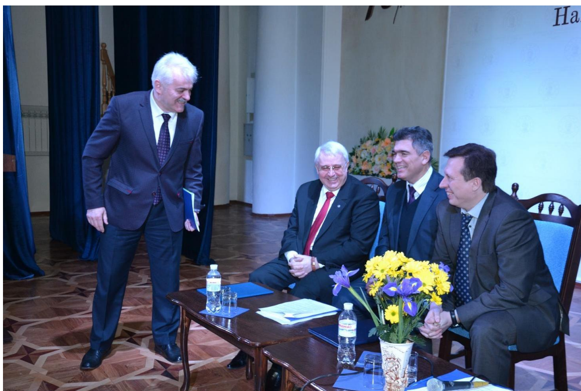
Після успішного завершення конференції, 2018 рік