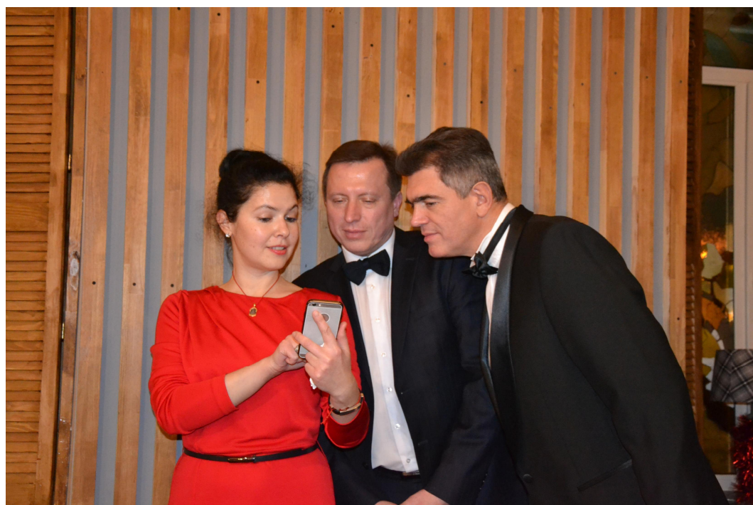
З колегами на новорічних урочистостях, 2018 рік