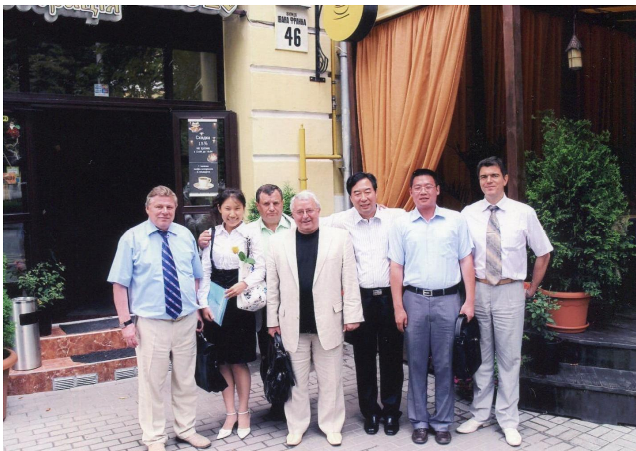
Зустріч з делегацією технологічного університету Чаньджоу (КНР), 2012