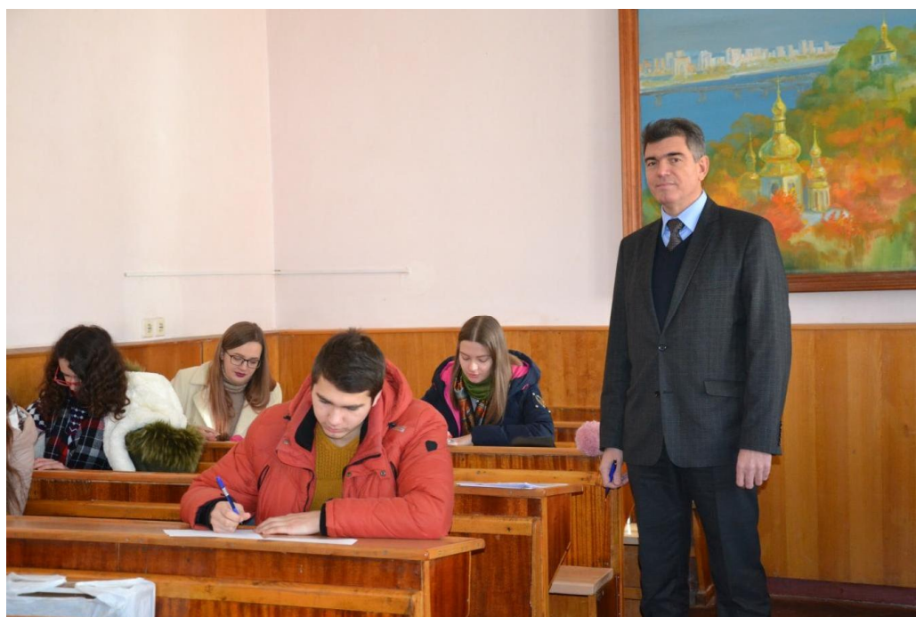
Лекція з теоретичної фізики для студентів IV курсу фізико-математичного факультету, 2017 рік