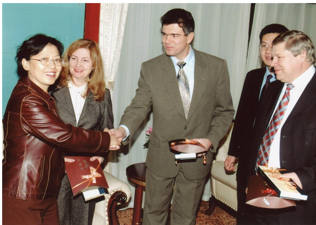
Знайомство делегації НПУ імені М. П. Драгоманова з технологічним інститутом м. Чаньджоу, Китай, 2006 рік