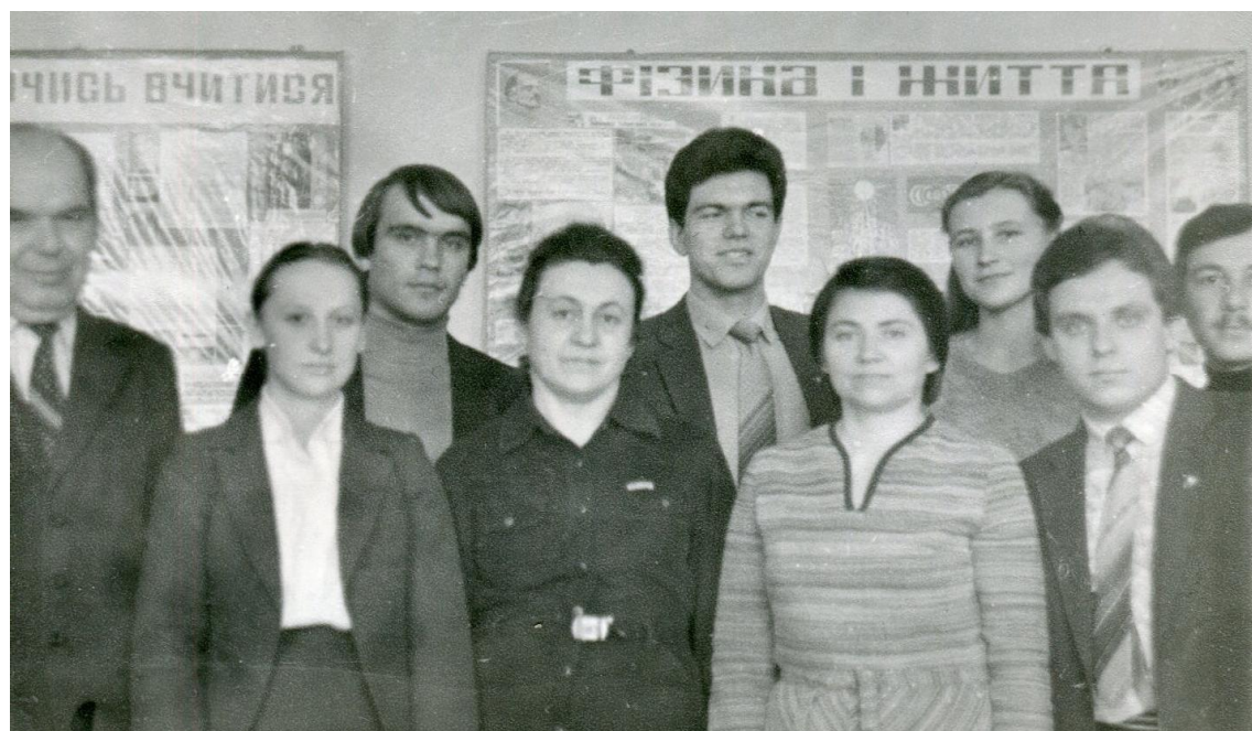
Педагогічна практика студентів 31фа групи спеціальності "Фізика і астрономія" у фізичному кабінеті СШ № 46 м. Києва із завучем та вчителями фізики, 1984 рік