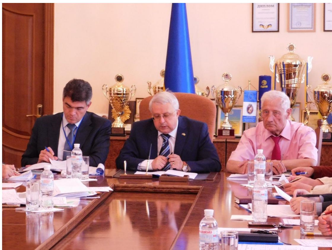
Обговорення перспектив розвитку університету на засіданні ректорату, 2019 рік