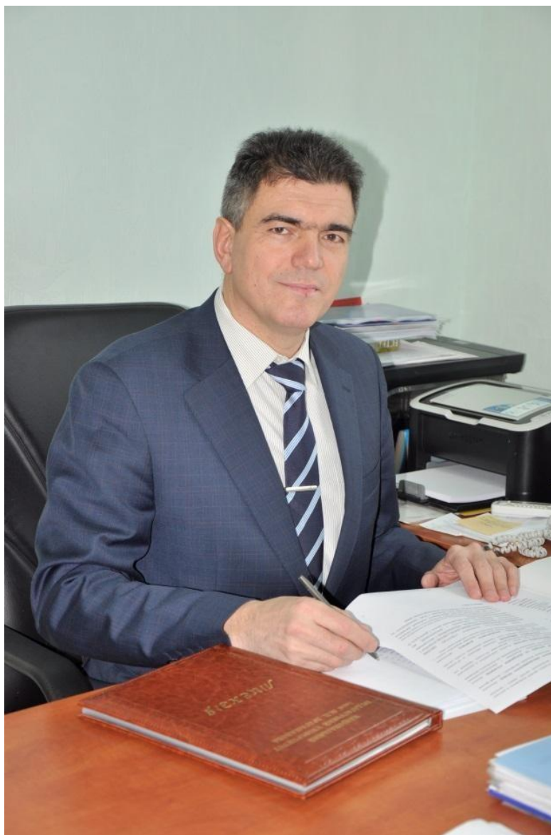
За звичною справою: аналіз ліцензійних матеріалів перед розглядом на Державній акредитаційній комісії, 2012 рік