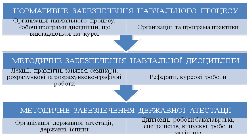
Рис. 2. Структура нормативно-методичного забезпечення