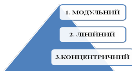
Рис. 1. Способи побудови навчальних програм

дисциплін, визначаються взаємозв'язки між ними. Вона фіксує конкретний зміст освіти і зміст навчання з окремої навчальної дисципліни [11]. Сукупність навчальних програм за фахом дає цілісне уявлення про зміст професійної підготовки фахівців економічної галузі, тому рівень розробки їх є одним із факторів, що визначають якість професійної підготовки майбутніх фахівців (бухгалтерів, економістів, фінансистів, банкірів). Існує кілька способів побудови навчальних програм: модульний, лінійний, концентричний, що відображено на рисунку 1.