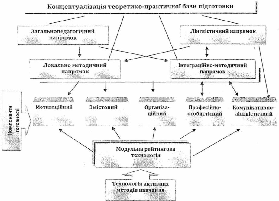
Рис.1 Модель функціональної структури професійної підготовки фахівців до навчання іноземної мови дітей дошкільного віку

Саме таке розуміння фахової підготовки та якості фахової готовності постало базисом побудови експериментальної частини дослідження. Були визначені та продіагностовані складові у відповідності до змістовного навантаження професії, що опанується студентами експериментальних груп: мотивація, професійно значущі якості та рівень розвитку іншомовних лінгвістичних здібностей (в загальному та професійно спрямованому ракурсі). Відповідно до цього був здійснений аналіз психологічних передумов та лінгвістичного базису цілеспрямованої професійної підготовки у студентів експериментальних (ЕГ) та контрольних груп (КГ), опрацювання результатів якого показало в усіх студентів перспективний рівень наявності професійно значущих особистісних якостей, достатній рівень психологічної готовності до здійснення майбутньої професійної діяльності та досить посередній рівень мовної підготовленості потенційних фахівців.