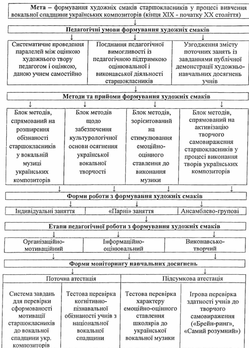
Рис. 1 Методична модель формування художніх смаків старшокласників у процесі вивчення вокальної спадщини українських композиторів