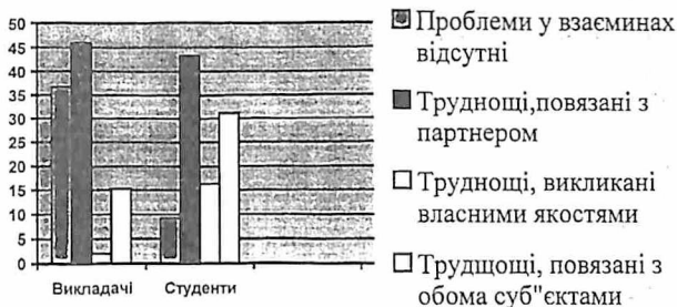
Рис. 1. Усвідомлення викладачами і студентами труднощів у взаєминах

4). Виявлені суттєві відмінності в уявленнях викладачів і студентів педагогічного коледжу про оптимальні взаємини і власну роль у їх становленні. Студенти (86,3%) пов'язують їх, насамперед, із педагогічним тактом викладача, його повагою до них, ввічливістю й доброзичливістю, проявом довіри, об'єктивністю й справедливістю. Для старшокурсників (особливо після педагогічної практики) важливо, щоб викладачі вбачали в них своїх колег. Щодо своєї ролі в оптимізації взаємин, то лише 3,4% студентів усвідомлюють важливість із свого боку такту до викладача, бути дисциплінованим і добросовісно виконувати свої обов'язки. Хоча 26,5% викладачів і пов'язують можливість їх покращання завдяки змінам власної системи настанов щодо вихованців (бути тактовним, намагатися враховувати думку студентів, бути відвертим у стосунках із ними, розуміти їх тощо), однак більшість із них не розуміють цього, що свідчить про невисокий рівень їхньої психологічної культури.