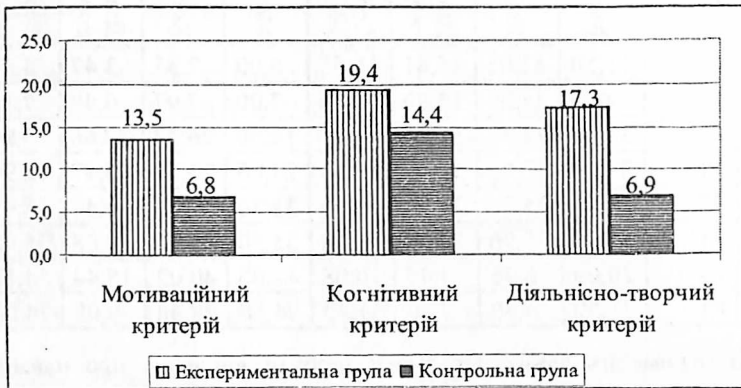
Рис. 1. Динаміка змін у навчальних досягненнях старшокласників з композиції в експериментальній і контрольній групах

Отже, в результаті проведеного дослідження доведено ефективність розробленої методики навчання композиції старшокласників у допрофесійній художній освіті.