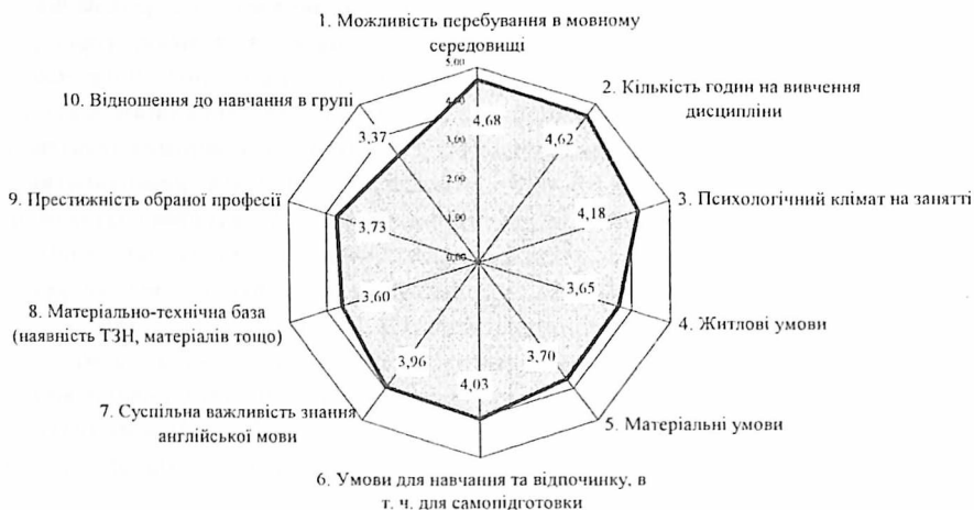
Рис. 3. Експертне оцінювання впливу зовнішніх умов на підготовку майбутніх учителів англійської мови

Отримані результати дозволили нам зробити висновок, що при підготовці майбутніх учителів англійської мови існує потреба в збільшенні кількості навчальних годин на вивчення іноземної мови та дисциплін професійного спрямування (рис. 3).