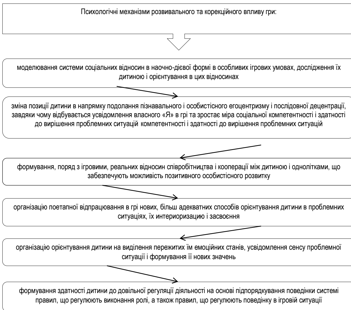
Рис. 2. Психологічні механізми розвивального та корекційного впливу гри.

Важливо організувати процес розвитку і формування навичок спілкування дітей з ЗГР в формі гри, де максимально виявлялася і реалізовувалася активність дитини, розвивалися відносини за типом близькості (співпраці, дружби) дитячо-дорослого співтовариства.