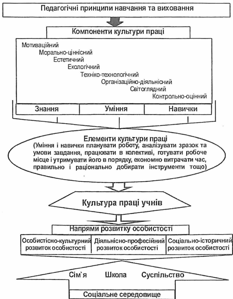
Рис. 1. Модель формування культури праці учнів основної школи

процесу. Склад контрольних і експериментальних груп протягом усього періоду дослідження був незмінним. Усі школярі на початку проведення експерименту мали приблизно однаковий рівень сформованості культури праці.