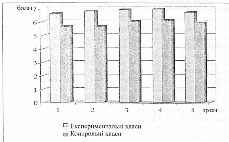
Рис. 2. Результати експериментальної роботи

На другому етапі уточнювалися теоретичні позиції формування методичної концепції дослідження, розроблялися навчальні проєкти, спрямовані на формування інтересу учнів, а відповідно і розвиток розумових здібностей, мислення, загальний розвиток, на освоєння навчального матеріалу програми. Метою педагогічного експерименту на цьому етапі було уточнення і перевірка розроблених тем та проєктів з використанням цікавих дидактичних засобів. В експерименті брали участь 383 учні. На початку експерименту та по його закінченні у кожному класі були проведені контрольні роботи. Результати контрольних робіт визначалися за 12-бальною шкалою. Для порівняння одержаних результатів використовували середньоарифметичні кількості балів, отриманих учнями за виконання контрольних робіт. Для оцінки статистичної значущості відмінності між результатами застосовували критерій Пірсона (метод \chi^2 ). Аналіз даних, отриманих у ході педагогічного експерименту, дозволив розкрити загальну тенденцію впливу інноваційних дидактичних засобів на перебіг й результативність навчально-пізнавальної діяльності школярів, ступінь формування їх пізнавального інтересу та розвиток умінь, навичок і здібностей. Результати педагогічного експерименту подано на рис.2.