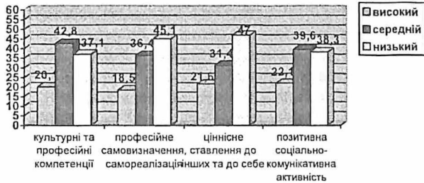
Рис. 1. Особливості розвитку структурних компонентів гуманістичної спрямованості майбутнього соціального педагога

Узагальнені результати експериментального дослідження соціально-когнітивного, мотиваційного, емоційно-ціннісного та конативного компонентів гуманістичної спрямованості майбутнього соціального педагога відображено на рисунку 1.