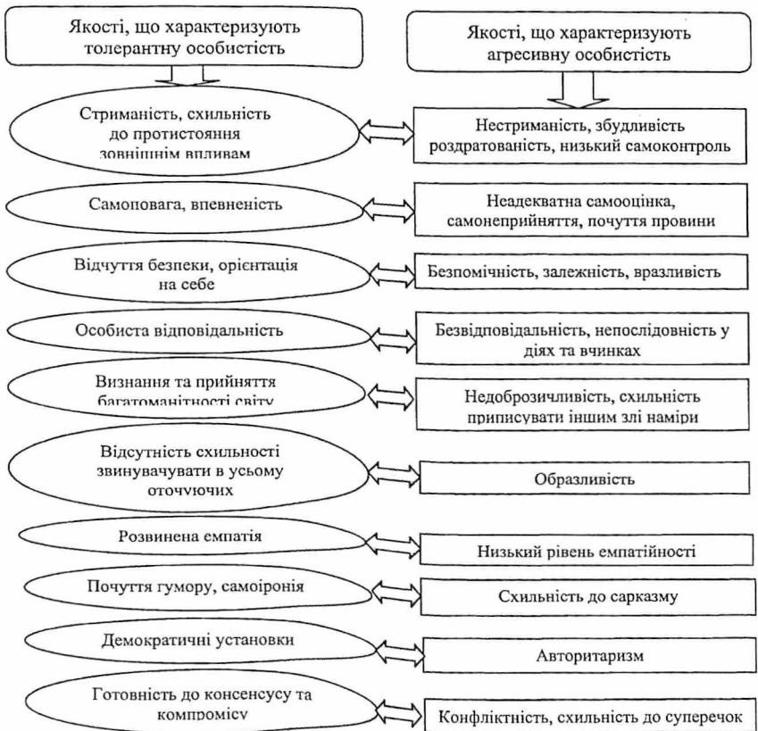
Рис. 1. Модель антитетичних зв'язків між толерантністю та агресивністю підлітків.

Теоретичний аналіз та емпіричні дані дозволили розробити модель антитетичних зв'язків між агресивністю та толерантністю у підлітковому віці (рис.1).