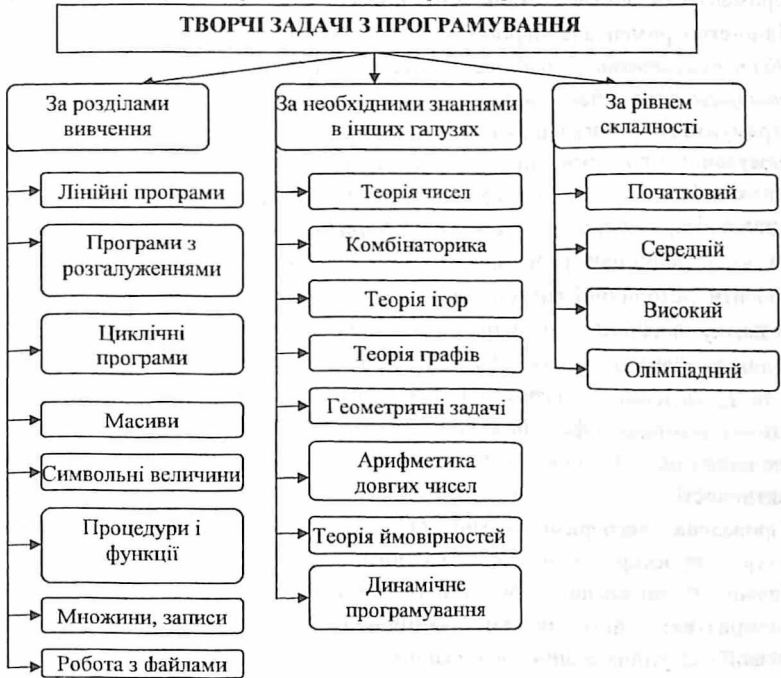
Рис. 2. Класифікація творчих задач із програмування

програмування (див. рис. 2), за якою такі задачі розподіляються на три блоки: за розділами вивчення (передбачається розв'язування задач за основними темами вивчення дисципліни "Програмування"), за необхідними знаннями в інших галузях (зроблено акцент на задачах, при розв'язуванні яких мають використовуватися базові знання з відповідних предметних галузей), за рівнем складності (акцентується увага на задачах різних рівнів складності).