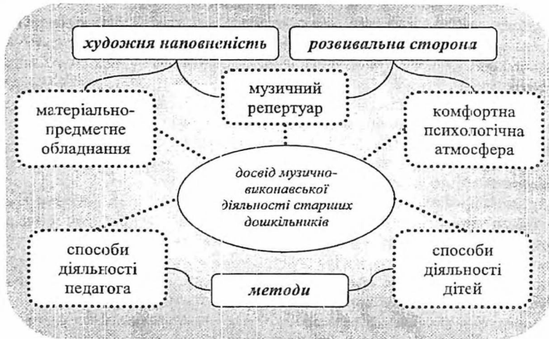
Рис. 1. Модель художньо наповненого розвивального середовища як умови успішного формування досвіду музично-виконавської діяльності у старших дошкільників

В основу експериментальної методики покладено модель художньо наповненого розвивального середовища як умови успішного формування досвіду музично-виконавської діяльності у старших дошкільників (рис. 1). У межах цієї моделі виокремлено дві групи методів . Перша група, у якій узагальнено способи діяльності педагога, об'єднує методи музично-стилістичних трансформацій дитячого репертуару, включення у музично-виконавську діяльність дошкільників засобів мультимедіа, сюжетного ознайомлення з кожним новим музичним твором, сценарної драматургії музичних свят, введення музичної інформації в пам'ять дітей під час засинання (природного денного сну). Друга група, у якій узагальнено способи діяльності дітей, об'єднує методи інтеграції різних видів музично-виконавської діяльності, оперування елементами музичної виразності, спрямованого залучення дітей до імпровізації, взаємовідвідувань.