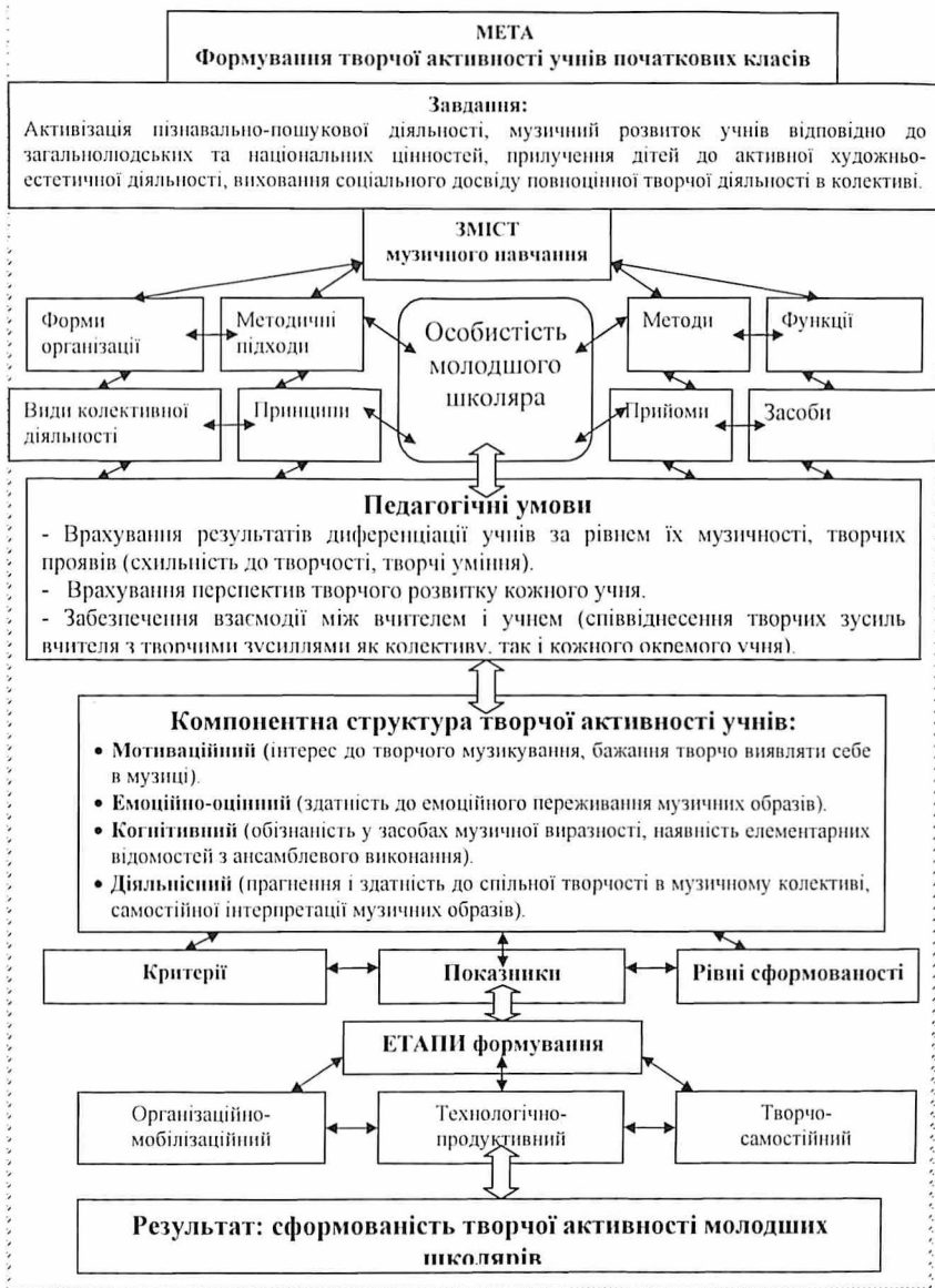
Рис.1 Методична модель формування творчої активності молодших школярів засобами колективної музичної діяльності