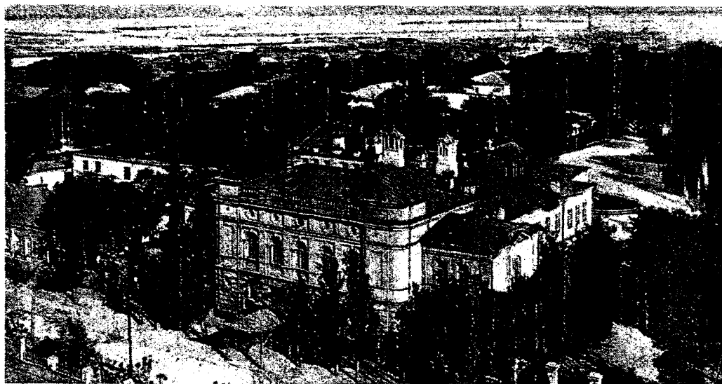
Катеринослав, загальний вигляд, Англійський клуб (фото початку XX ст.)

У новий 1914 рік просвітянський рух на Катеринославщині вступив повний сил та надій. У самій катеринославській «Просвіті» в цей час нараховувалося 235 членів, у мануйлівській – 75, перещепинській – 66, дівській – 49, гупалівській – 17 14 . На початку року катеринославські просвітяни розгорнули широку підготовку до Шевченківського ювілею. 19 січня 1914 р. у приміщенні Англійського клубу відбулося засідання організаційного комітету по влаштуванню Шевченківських урочистостей. Це зібрання було скликане правлінням катеринославської «Просвіти», яке виклопотало дозвіл на організацію цього комітету з правом входження до нього також осіб, які не належали до «Просвіти». На цьому засіданні була обговорена та схвалена програма ювілейних урочистостей на честь великого Кобзаря 15 .