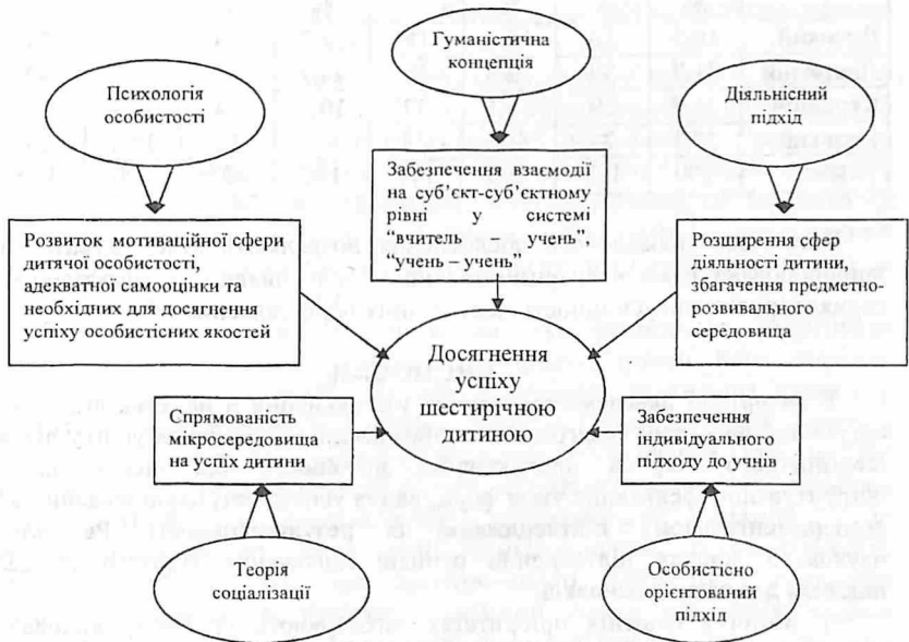
Рис. 2. Педагогічні умови досягнення успіху шестирічною дитиною

Різноманітні форми освіти батьків (лекторій, консультації, батьківські збори, бесіди, прес-конференції з проблем сімейного виховання, дні відкритих дверей), а також такі нетрадиційні форми роботи, як зустрічі за круглим столом, проведення дискусійного клубу, створення “Сімейної скриньки” (містить добірку матеріалів із досвіду родинного виховання), альбому-естафети “Наші успіхи”) були покликані розкрити значення сімейної атмосфери, ставлення до дитини для вироблення у неї орієнтації на успіх, умінь його досягати. Така система роботи дозволила забезпечити створення педагогічних умов, які сприяли досягненню успіхів шестирічною дитиною (рис. 2).