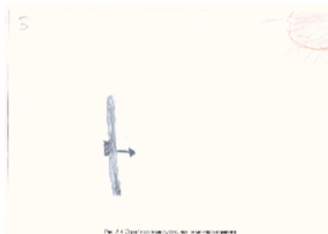
Рис. 2 Сприймання минулого, яке не можна виправити