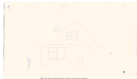
Рис.3. Я в сім'ї батьків, сім'я в мою відсутність

П.: . Що знаходиться знизу малюнку, це вода?