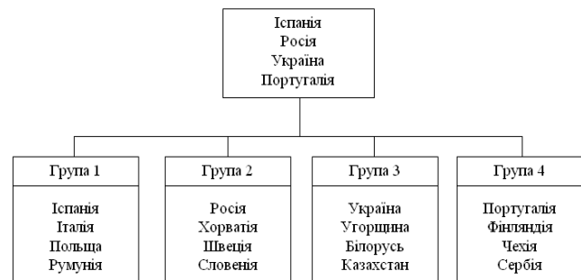
Рис. 1. Система відбору жіночих національних збірних команд до фінальної частини Євро 2019 з футболу

Таким чином, результати проведеного чемпіонату засвідчують важливе значення роботи, вико-