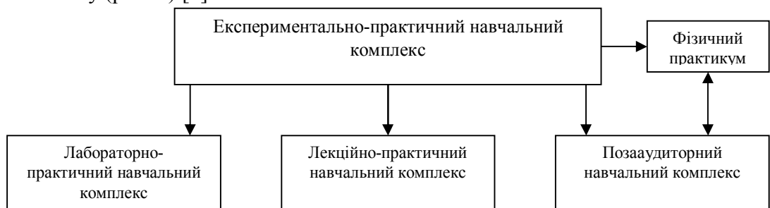
Рис. 1. Зв'язок фізичного практикуму зі складовими експериментально-практичного навчального комплексу.

Експериментальні роботи та завдання фізичного практикуму проводяться з метою повторення, поглиблення, розширення та узагальнення одержаних знань з різних тем курсу загальної фізики; розвитку та вдосконалення у студентів експериментальних умінь шляхом використання більш складного обладнання, більш складного експерименту; розвитку експериментальної інтуїції та дослідницьких якостей; формування у них самостійності при вирішенні завдань, пов'язаних з експериментом. І хоча виконання робіт фізичного практикуму не пов'язане безпосередньо з вивченням конкретних тем курсу загальної фізики та здійснюється після завершення вивчення всіх розділів курсу загальної фізики. Фізичний практикум можна цілком вважати відокремленою складовою експериментально-практичного навчального комплексу (рис. 1) [2].