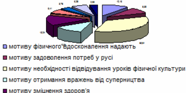
Рис. 1. Дані, які характеризують відповіді учнів 9 класів про їх мотиви до занять фізичною культурою

На запитання анкети «Якому з мотивів, що характеризують ставлення до занять фізичною культурою, Ви надаєте перевагу?» відповіді учнів 9 класів розподілилися наступним чином: мотиву фізичного вдосконалення надають перевагу 10,16% опитаних учнів 9 класів, мотиву задоволення потреб у русі – 8,59%, мотиву необхідності відвідування уроків фізичної культури – 35,81%, мотиву отримання вражень від суперництва (відчуття азарту, радощів від перемоги) – 10,94%, мотиву зміцнення здоров'я – 15,04%, мотиву досягнення спортивних результатів – 6,41%, мотиву знайти собі друзів – 3,78%, мотиву бути привабливим для інших – 6,28%, мотиву поліпшення тілобудови – 2,99% (рис. 1).