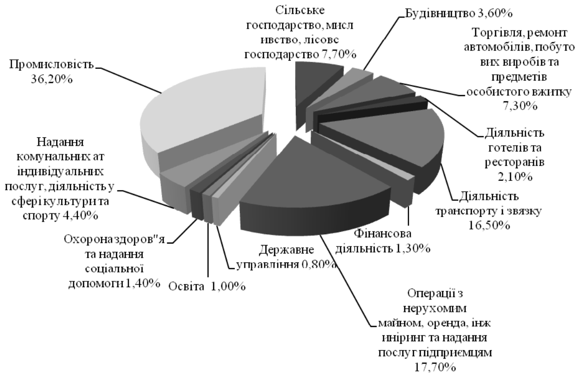
Рис. 1. Розподіл інвестицій в основний капітал за видами економічної діяльності у 2011 р.

Сільське господарство функціонує в умовах граничного дефіциту інвестицій: протягом 2011 року освоєно 18,2 млрд. грн. в основний капітал, з них за рахунок коштів державного бюджету освоєно 316,8 млн. грн., що становить 1,7% у відсотках до загального обсягу інвестицій в основний капітал за видом економічної діяльності [2, с. 19].