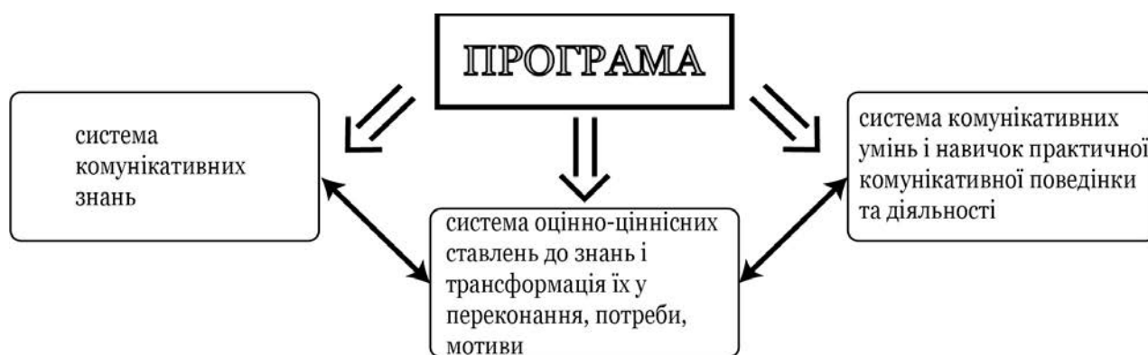
Рис. 1. Завдання реалізації програми формування комунікативної культури студентів закладів вищої технічної освіти

Реалізація експериментальної програми передбачає формування в студентів : системи комунікативних знань (тобто знань про людину, її взаємини та взаємодію з іншими людьми, про спілкування як специфічний вид діяльності, який передбачає не лише і не стільки обмін інформацією, а обмін емоціями, взаємовплив, взаємодію і взаємозалежність), системи оцінно-ціннісних ставлень до цих знань і перетворення їх в особистісні установки, потреби, мотиви, системи комунікативних умінь і навичок практичної комунікативної поведінки та діяльності (рис. 1.).