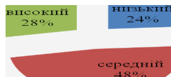
Рис.1 Рівні сформованості національної свідомості дітей молодшого шкільного віку

У дослідженні прийняло участь 25 дітей 3-го класу Вичівської ЗОШ. Аналіз отриманих результатів показав (рис.1), що 28% дітей мають низький рівень національної свідомості, який слабкою спонукально-позитивною діяльністю. Національні цінності даних дітей є нестійкими. Вони не проявляють ініціативи у виховній роботі патріотичного та національного спрямування.