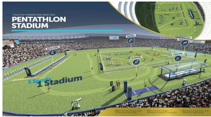
Рис.1. Сучасний Пентатлон-стадіон, на якому будуть проходити змагання з сучасного п'ятиборства на XXXII Олімпійських іграх в Токіо (Японія) у 2020 році.

Завдяки такій інноваційній діяльності сучасному п'ятиборству вдалось зберегти статус "олімпійського" виду до 2024 року на XXXII Олімпійських іграх в Парижі, що було затверджено на 130-му засіданні МОК у 2017 році. Однак, не вирішеним залишилось питання додаткової медалі, яку UIPM презентувало МОК для включення до програми Олімпійських Ігор - змагань змішаної естафети (мікст). Втім, президент МОК подякував UIPM за презентацію та закликав продовжити роботу в цьому напрямі. Інноваційна діяльність UIPM була спрямована не лише на модернізацію формату проведення змагань, але і на заходи щодо популяризації сучасного п'ятиборства в усьому світі. З цією метою було створено "Піраміду розвитку UIPM", до складу якої увійшли: сучасне п'ятиборство, як олімпійський вид спорту, та п'ять субвидів - біатл, триатл, шкільний біатлон, тетратлон та лазер-ран, які мають щільний зв'язок з сучасним п'ятиборством [5, 6, 7, 8, 9, 10].