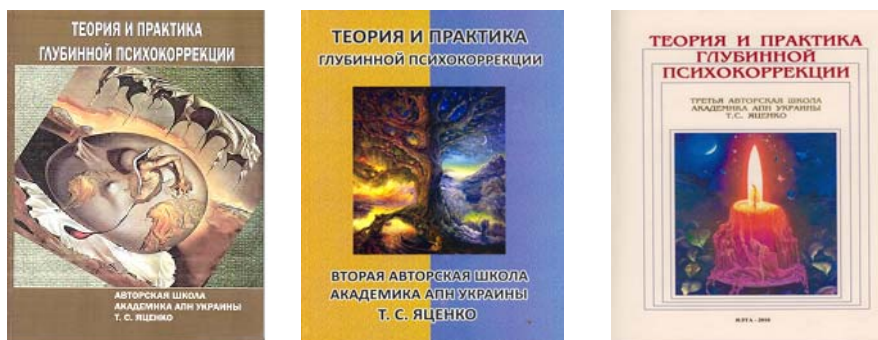
Фото 21. Три посібники за результатами Авторських шкіл виданих при РВНЗ КГУ (м. Ялта)