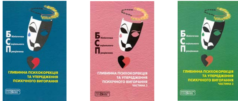
Фото 20. Посібник “Глибинна психокорекція та упередження психічного вигорання” в 3-х частинах

- “Теоретичні та методичні засади глибинної корекції: проблема психічної адаптації” (2 – 4 жовтня 2008 року), м. Ялта був зорієнтований на визначення глибинно-психологічних аспектів проблем соціалізації особистості, ознак її відкорегованості та психічного здоров'я загалом. За матеріалами семінару подано до друку збірник наукових статей у Науковому часописі НПУ імені М. П. Драгоманова [13].