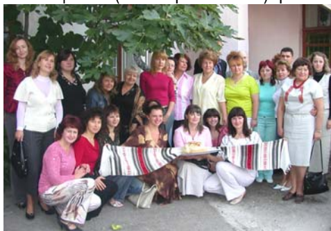
Фото 5. У дворі (біля Центру) учасники урочистого відкриття

У функції Центру входить як проведення наукових досліджень, так і розробка на їх основі методів групової та індивідуально-особистісної корекції, що спирається на цілісне розуміння психіки особистості в її свідомих та несвідомих виявах. Наукові дослідження в Центрі базуються на відео- та аудіозаписах емпіричного матеріалу діагностико-психокорекційної практики, яка проводиться зі студентами РВНЗ КГУ та психологами України, що сприяє формуванню бази пошуково-практичних досліджень, які знаходять реалізацію в написанні кандидатських та докторських дисертацій, що є важливим для розвитку вітчизняної психологічної науки. Діяльність Центру глибинної психології актуалізувала психологічні науково-дослідні пошуки неусвідомлюваних детермінант деструктивних тенденцій психіки, таких як агресія та тенденції до психологічної імпотенції і психологічної смерті, провідним керівником яких виступив Олександр Володимирович Глузман. Все це сприяло об'єктивуванню детермінант енергії мортідо, що має вияв в агресивній поведінці.