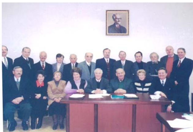
Фото 1. Члени відділення “Психологія, вікова фізіологія та дефектологія” НАПН України, 1995 р.