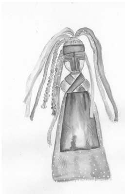
Рис. 1. Замальовка О. Скляренко, 2017.

Визначення “ реконструкція ляльки ” зафіксовано у книзі О. Скляренко “Лялька у культурі українців”[4]. “Реконструкція – метод історичного дослідження, який передбачає аутентичність. Оскільки ляльку потрібно вивчити у соціально-культурному контексті, як однієї з можливостей вивчати побут, культуру, традиції. Важливо знати: з чого робили, для чого, хто робив, у якому регіоні” [4, с. 243].