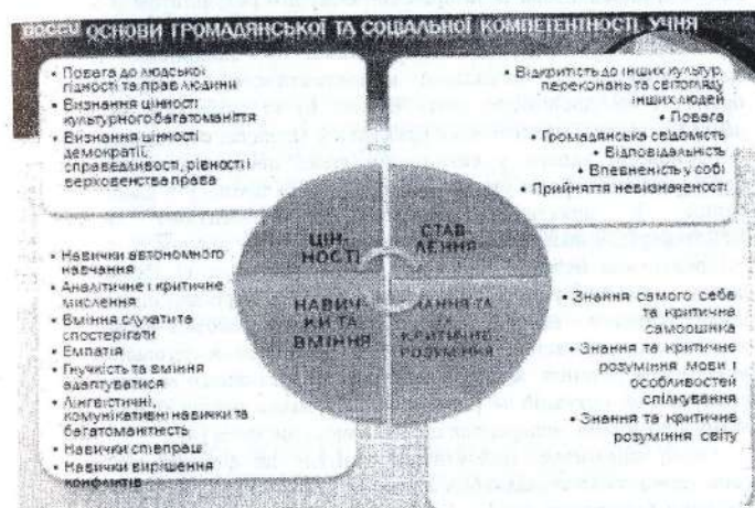
Рис. 1. Структура громадянської та соціальної компетентностей учня

уявленнями людини про себе, сприйняття себе як соціального суб'єкта тощо; 4) знаннями про загальнолюдські норми і цінності, а також норми (звички, звичаї, традиції, закони тощо) в різних сферах і галузях соціального життя – національної, політичної, релігійної, економічної, духовної та ін.; 5) уміннями і навичками ефективної соціальної взаємодії (володіння засобами вербальної і невербальної комунікації, механізмами взаєморозуміння в процесі спілкування); 6) вмінням раціонально добирати зміст, форми, методи та методичні прийоми для формування у молодших школярів громадянської та соціальної компетентностей у інтегрованому предметі «Я досліджую світ» [5].