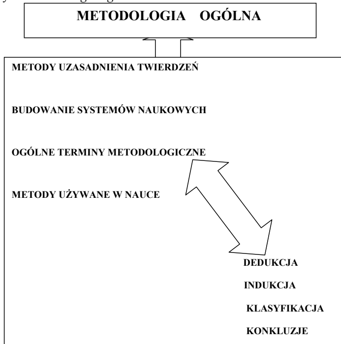
Rys.1. Metodologia ogólna

Postępowanie badawcze jest kolejnością logicznego myślenia, które jest ujęte w fazy badawcze, a normą pisarską bezosobowy styl eksponowania myśli. Analiza stanu faktycznego zawsze poprzedza jakiś projekt, założenia, wyjaśnienia teoretyczne w oparciu o stosowane w badaniach naukowych pojęcia, metody, techniki oraz narzędzia badawcze. Następnie skolekcjonowane i pogrupowane dane - fakty naukowe składają się na statystyczny- ilościowy lub jakościowy materiał badawczy, który podlega wyjaśnieniu i analizie. Następnie prezentuje się go w postaci opisu. Cały proces badawczy powinien opierać się na rzetelności z uwzględnieniem kolejności wykonywanych czynności badawczych tak, aby zapewnić właściwą strukturę pracy naukowej.