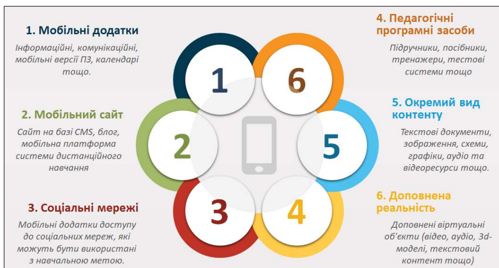
Рис. 4. Мобільні засоби змішаного навчання