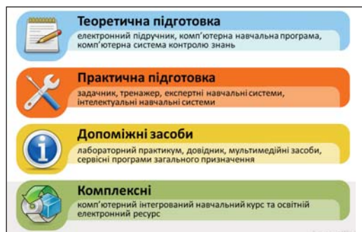
Рис. 2. Класифікація електронних засобів навчання