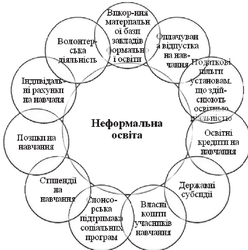
Рис. 3. Структура фінансування неформальної освіти у Німеччині

Неформальна освіта у ФРН також здійснюється за рахунок субсидій, позики на навчання, спонсорської підтримки тощо (рис. 3).