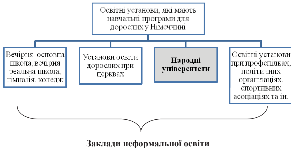
Рис. 2. Освітні установи, які мають програми для освіти дорослих у Німеччині

Водночас, характерною ознакою неформальної освіти Німеччини є висока активність організацій і установ. Так, нині у ФРН нараховується понад 2000 акредитованих державою установ з освіти дорослих, діяльність який підтримується з бюджетних коштів.